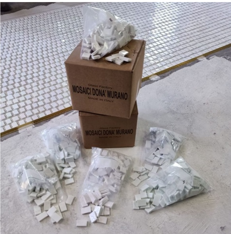
Figura 2: Tozzetti Carlo Scarpa colore Bianco formato Standard