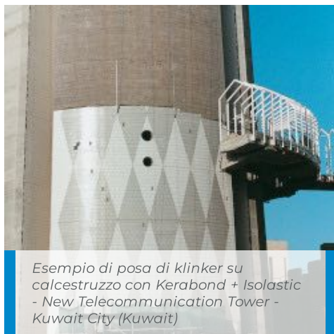
Esempio di posa di klinker su calcestruzzo con Kerabond + Isolastic - New Telecommunication Tower - Kuwait City (Kuwait)